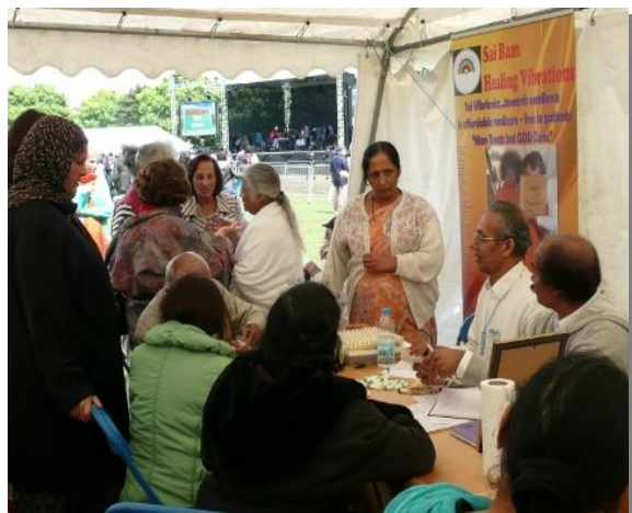
Stoisko z Wibroniką na święcie Jedności Wyznań w Southhall Park, w Londynie