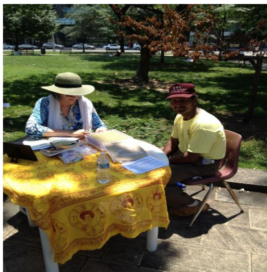
Wibronika w Parku w Waszyngtonie, USA. Służba dla bezdomnych